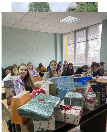
Свято "Хелуїн"; свято "Темний Миколай".